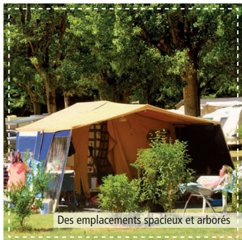
Des emplacements spacieux et arborés