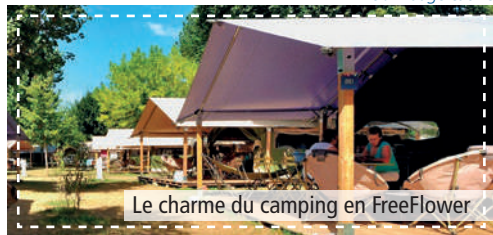
Le charme du camping en FreeFlower