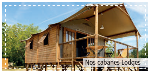
Nos cabanes Lodges

The charm of camping with the added bonus of comfort. The campsite offers rentals in mobile homes of 1, 2 or 3 bedrooms, Freeflower tented habitats and wooden chalets.