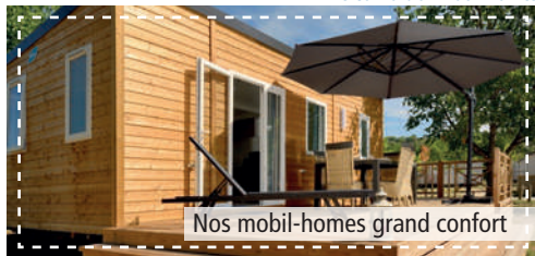
Nos mobil-homes grand confort