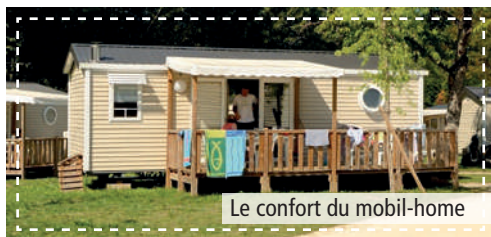
Le confort du mobil-home